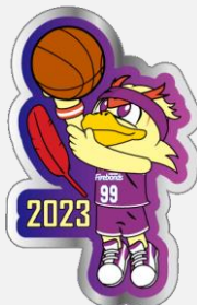
福島ファイヤーボンズ 【バスケットボール】